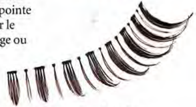
Par groupes de trois ou ultradenses, les faux cils MAC sont vendus au prix unique de 29 fr.