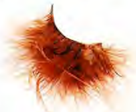
Faux cils Shu Uemura dès 13 euros.