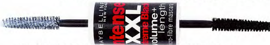
Superprix Et volume XXL grâce à un booster de cils. Intense extrablack , Maybelline , 18 fr. 90.