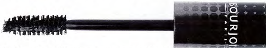
Couleur intense Pour les clubbeuses, maxibrosse et formule enrichie en vinyle. Volume clubbing , Bourjois , 21 fr. 70.