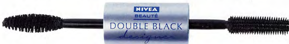
Coup double Deux effets: séparer puis étoffer. Double Black designer , Nivea Beauté , 19 fr. 90.