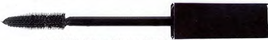
High-tech Une toute nouvelle brosse souple et précise en élastomère. Inimitable, Chanel , 39 fr.