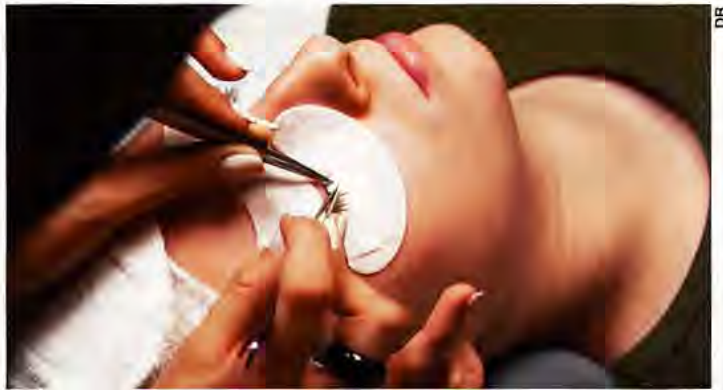
Le contour de l'œil protégé, les extensions sont posées cil par cil.

Déroulement d'une séance: Après un bilan de la santé des cils, les extensions, toujours en polyester, sont fixées une à une (sur le cil naturel jamais sur la paupière) à l'aide d'une colle spéciale, anallergique. Le contour de l'œil étant bien sûr protégé. La longueur des extensions, ainsi que leur nombre, dépend à la fois du «terrain» existant et de l'attente: regard «naturel», plus ou moins glamour, compensation de cils trop courts ou peu fournis, etc.