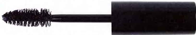
Volume et protection Brosse volumatrice et vitamine E antioxydante. Plush lash , MAC , 21 fr.